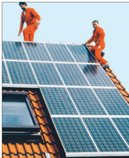
Für Kombi-Solarkollektoren gibt es attraktive Zuschüsse von bis zu 120 Euro je Quadratmeter.

Pelletkessel: Die bisherigen Förderungen bei Pelletöfen mit Wassertasche, Pelletkesseln und Holzhack-Schnitzelanlagen bleiben unverändert: Je Kilowatt Leistung gibt es 36 Euro bei einer Minimum-Förderung von 1000 Euro für